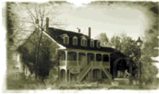
Musée de l'Auberge Symmes.

Le 15 octobre aura lieu la traditionnelle Fête de la moisson, une activité bien courue à l'occasion de laquelle jeunes et moins jeunes s'adonnent à la décoration de citrouilles et à la fabrication d'épouvantails.