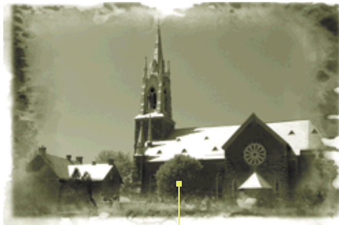
Église Saint-Paul, à Aylmer.

Il sera nécessaire, par ailleurs, que l'État exerce un rôle de leadership dans ce dossier, ne serait-ce qu'en assurant une meilleure concertation des divers ministères et organismes qui s'y rattachent, ou en mettant sur pied des équipes de spécialistes pouvant aider les gestionnaires d'édifices patrimoniaux à prendre les décisions les plus éclairées et les plus appropriées, ou même en stimulant la formation spécialisée dans certains métiers en voie de disparition ou en s'assurant que certains professionnels comme les architectes, les ingénieurs, les urbanistes acquièrent de meilleures connaissances face au patrimoine bâti.