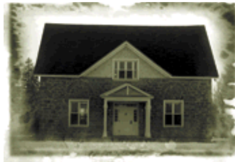
L'ancienne chapelle méthodiste du canton de Hull (1827) - la plus vieille église du Québec encore existante à l'ouest de Montréal, située au 495, chemin d'Aylmer (entrée sur la rue Golf)

Adresse postale : B.P. 476, Gatineau, QC J9H 5E7