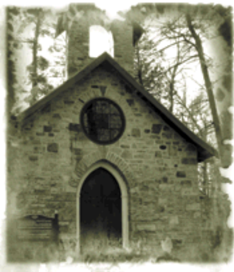
La chapelle funéraire des Papineau, à Montebello.

27 : Modifier la Loi sur l'aménagement et l'urbanisme afin que les municipalités régionales de comtés puissent inclure la liste des bâtiments religieux et cimetières sur leurs territoires respectifs.